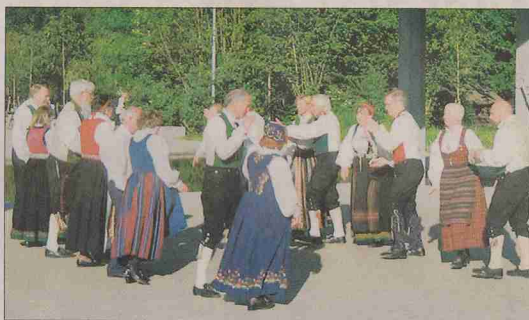
Sogn og Fjordaneringen has made the festival part of its 2007 U.S. visit.